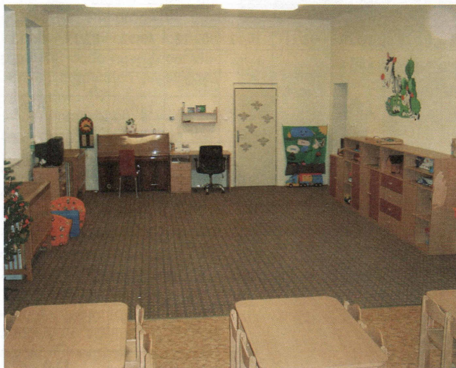
Pohled do herny po rekonstrukci