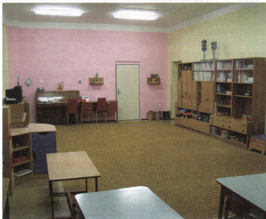
Pohled do herny před rekonstrukcí

Realizací projektu jsme ukončili celkovou rekonstrukci mateřské školy a nabídneme tak uživatelům maximální možnost využití v přijatelných podmínkách. Dále budou splněny veškeré normy, které za minulého stavu školka nesplňovala.