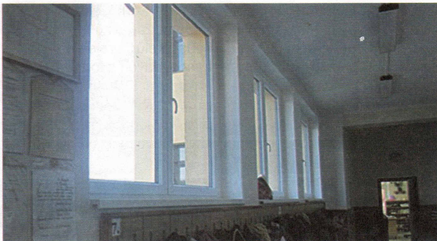
Bílá barva vnitřní strany oken koresponduje s malbou