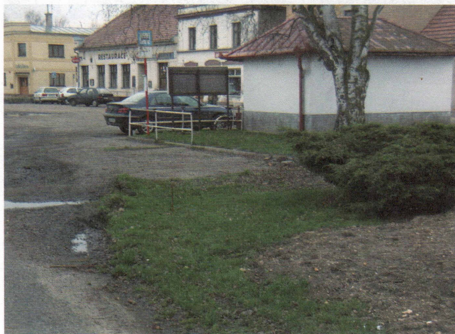
Zelená plocha určená ke vzniku propojovacího chodníku

Projekt rekonstrukce zastávky dopadá na cílovou skupinu obyvatel využívající hromadnou dopravu k dopravě do zaměstnání nebo jiným účelům.