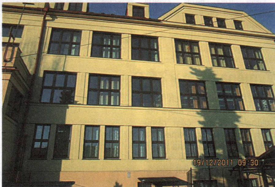
Výměna oken nezměnila venkovní vzhled školy.