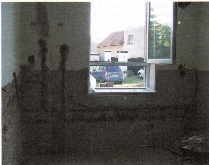
Takto vypadala kuchyň na počátku rekonstrukce.