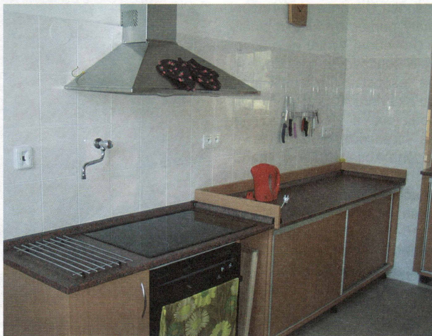
A takto vypadá nyní.