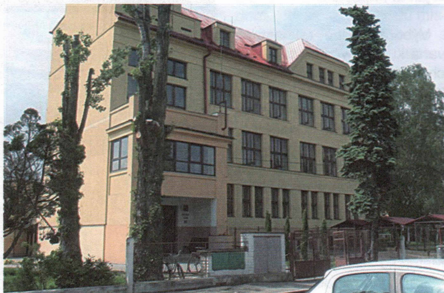
Okna v čachovické škole před rekonstrukcí.