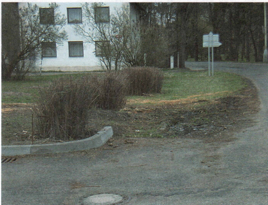
Nevyhovující nástupní plocha