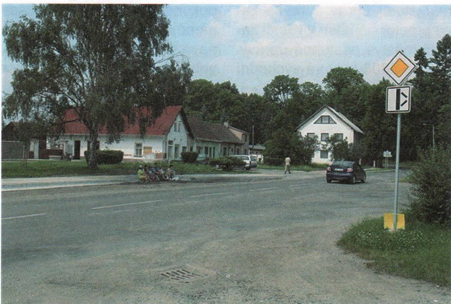
Nově vytvořený chodník na křineckém náměstí.

Redakční rada: Eva Pacltová, Mgr. Markéta Ottová, Lenka Náměstková, DiS. Grafická úprava: Jiří Pulda. Tisk: Tiskárna F-PRINT, Krchleby 35, tel.: 325 541 094, www.f-print.cz Registrační číslo: MK ČR E 19730. Náklad: 1500 ks.