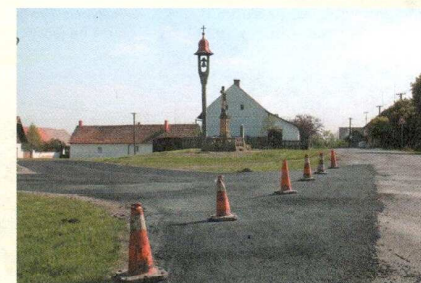
LEADER 2009 – obnova návsi obce Pojedy, průběh realizace