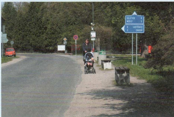
LEADER 2009 – chodníky lokalita Loučeň, před realizací

možno použít i do nové soustavy veřejného osvětlení s využitím nových operných bodů – ocelových stožárů.