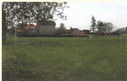
LEADER 2009 – inline dráha Rožďalovice, před realizací

Co se týká podzimního kola, už víme, že nebude otevřeno, jelikož se MAS podařilo přerozdělit mezi žadatele celou částku v kole jarním. V roce 2011 bychom chtěli postupovat následovně. Celkovou částku, kterou budeme rozdělovat (měla by být zhruba stejná jako v letošním roce) bychom rozdělili do dvou etap: kolo zimní (asi 01/2011) a podzimní (09/2011). Zároveň by nastala změna v otevírání fichí. Už by nebyly všechny otevřeny v obou kolech, ale dle připravenosti žadatelů by