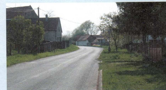
LEADER 2009 – obnova veřejné zeleně a výsadba nových travních ploch, obec Jíkev, před realizací

Na stávajících betonových stožárech byla osazena nová svítidla určená pro veřejné osvětlení. Použitá svítidla jsou zvolena tak, aby je v budoucnu bylo