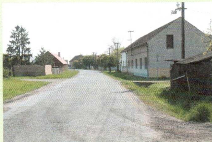
LEADER 2009 – orientační osvětlení obce Pojedy, před realizací