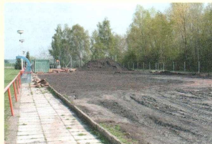
LEADER 2009 – rekonstrukce sportovního hřiště, Rejšice, před realizací