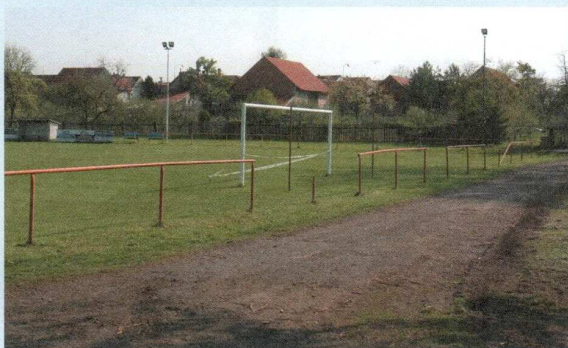
LEADER 2009 – renovace hřiště, vybudování ochranného zábradlí a pletiva kolem sportoviště, obec Jíkev

V ulicích Větrná a Májová bylo nutno v souvislosti s kompletní opravou komunikace přistoupit ke generální opravě veřejného osvětlení včetně výměny kabeláže a výměny sloupů veřejného osvětlení. Rekonstrukce veřejného osvětlení přispěje ke zvýšení bezpečnosti občanů i jejich majetku a zvýšení komfortu bydlení v této části obce.