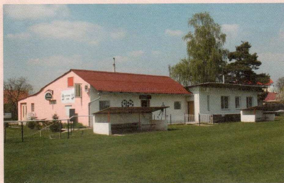
LEADER 2009 – multifunkční zařízení pro Sokol Lipník, před realizací