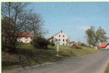
LEADER 2009 – úprava návěsného prostoru, obec Oskofínek, před realizací