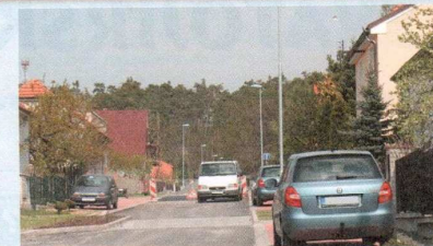
LEADER 2009 – generální oprava veřejného osvětlení, obec Všeňany, projekt již hotov