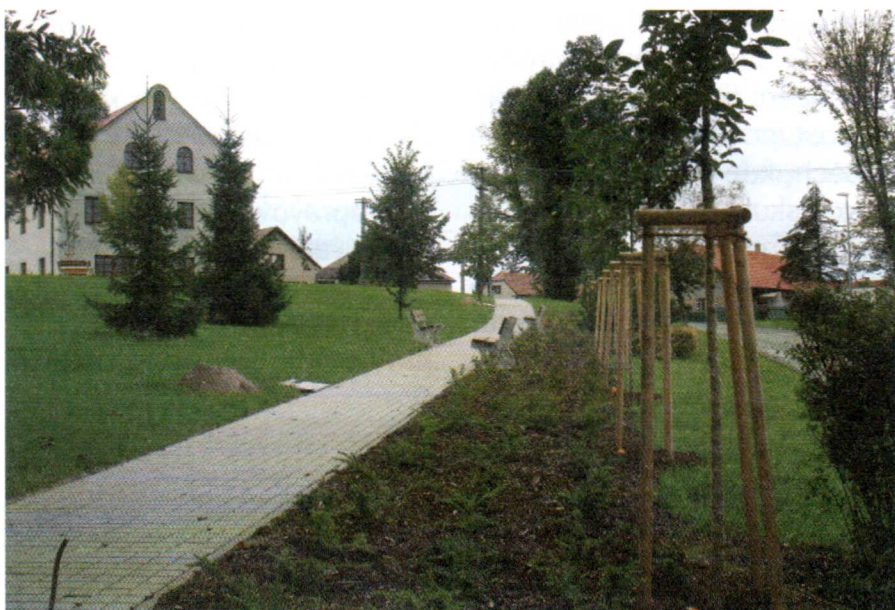
Návesní plocha v Oskořítku po úpravě

Co nás však trochu mrzelo, byly reakce několika málo našich občanů, kteří vyjádřili názor, že jsme nevhodně vynaložili peníze obce. Roz-