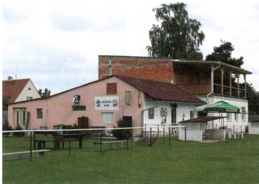
Kabiny v Lipníku po přestavbě