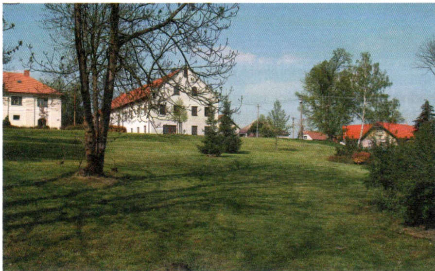
Návěsní plocha v Oskořínku před úpravou

Projekt se skládá ze sado- vých úprav chodníků a mobili- áře. Návěsní prostor na počát- ku přebudování nemá vyhra- něnou užitnou funkci. Stávající zeleň je tvořena pouze trav- natými plochami a náletovými stromy. Plochu tvoří spontán- ně vyšlapané pěšiny v travna- té ploše.