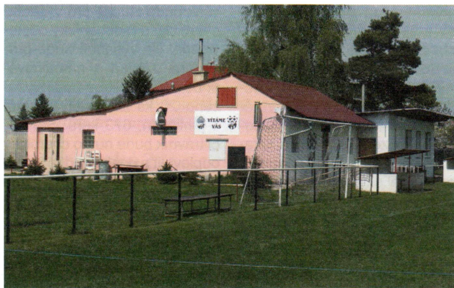
Kabiny v Lipníku před přestavbou

Kabiny a klubovna byly zkolaudovány do roku 2014 a vznikly přestavbou stavebních